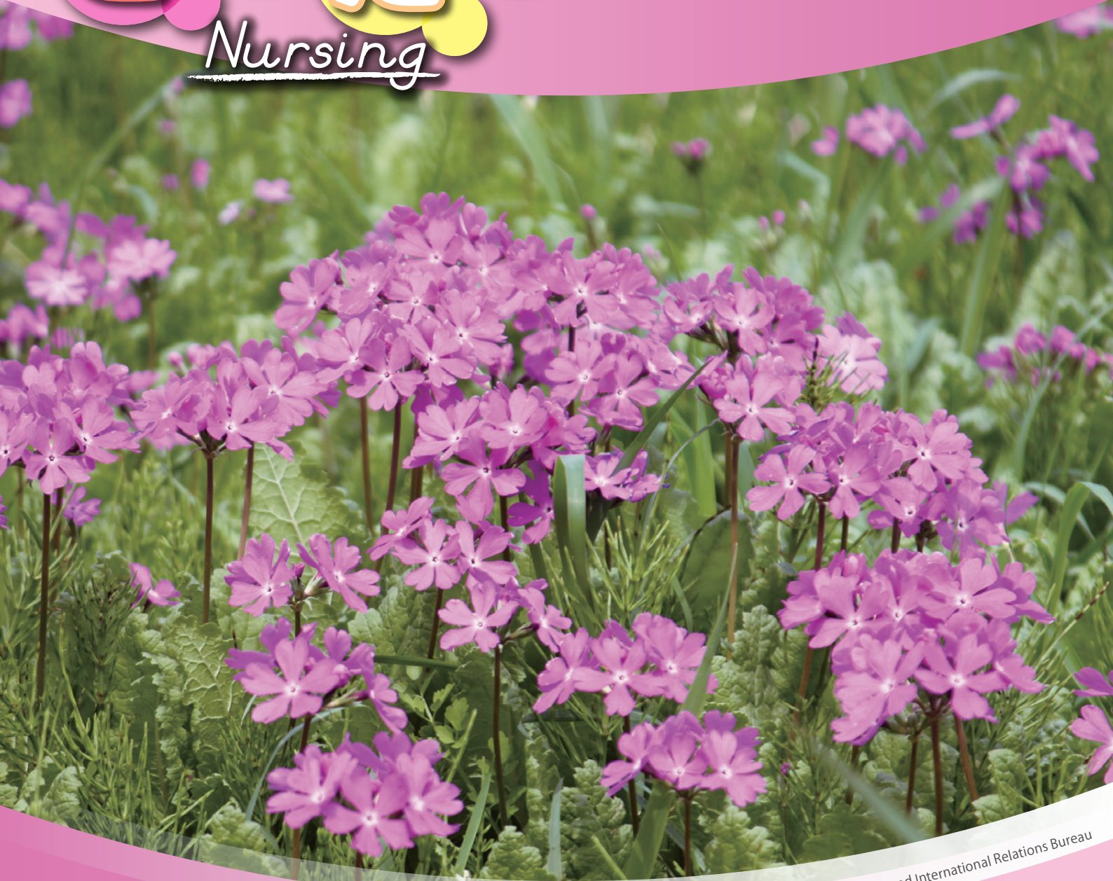
田島ヶ原のサクラソウ