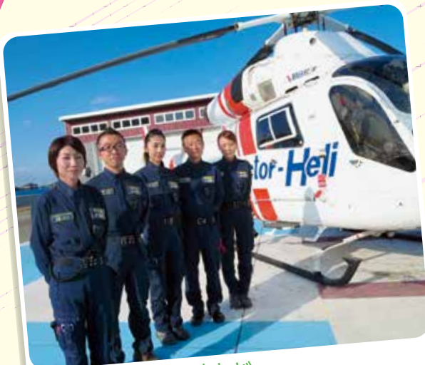
厳しい現場ですが チームワークで頑張っています