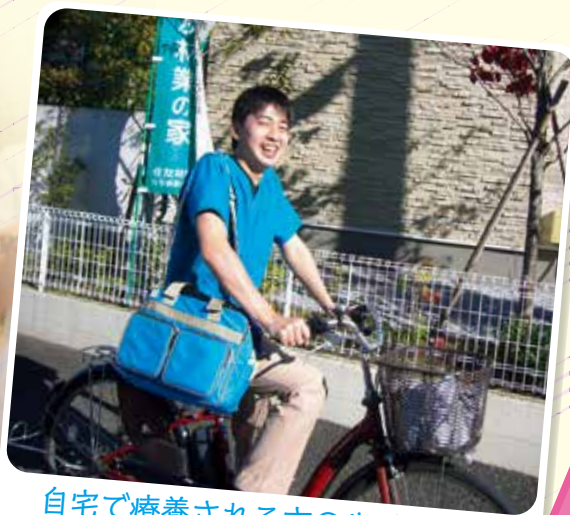
自宅で療養される方の生活を 私たち訪問看護師が支えます