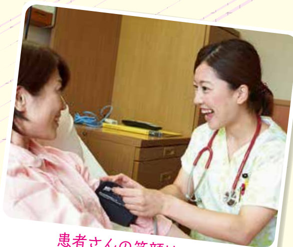
患者さんの笑顔は 私たちの活力です