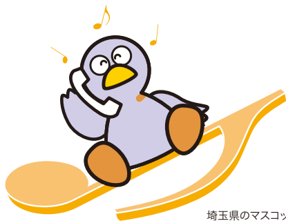
埼玉県のマスコット「コバトン」

〒338-0011 埼玉県さいたま市中央区新中里 3-3-8 埼玉地域看護研修センター 2F 公益社団法人 埼玉県看護協会内 TEL 048-824-7266 FAX 048-833-8500