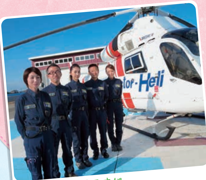
厳しい現場ですが チームワークで頑張っています