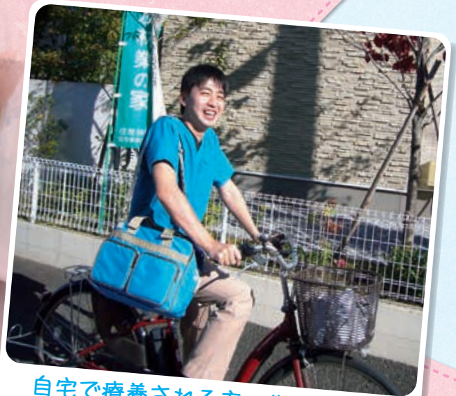
自宅で療養される方の生活を 私たち訪問看護師が支えます